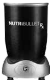
1 Motoreenheid met groot vermogen