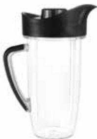
1 Lage beker met 1 lip ring