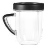
1 Lage beker met 1 Comfortring