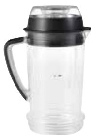
1 SouperBlast kan met 2-delige deksel